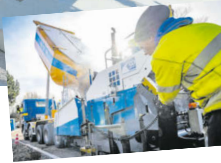
Belageinbau in Gockhausen Dübendorf

Mithilfe des patentierten Art-Beton-Modulsystems der Inauen Strassenbau AG lassen sich nicht-konforme Bushaltestellen über Nacht oder auch tagsüber innert 12 Stunden sanieren und zur barrierefreien Haltestelle umrüsten. Das patentierte Verfahren eignet sich zudem nicht nur zum Umrüsten bestehender Haltestellen, es kann auch für Neubauten eingesetzt wer-