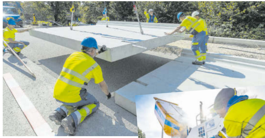
Einbau des Art-Beton-Modulsystems an der Eichholzstrasse in Volketswil

Das BehiG verlangt explizit, dass innert 20 Jahren ab Inkrafttreten alle Bushaltestellen per Gesetz behindertengerecht saniert sein müssen – das heisst, dass der Einstieg zwischen Haltekante und Bus barrierefrei erfol-